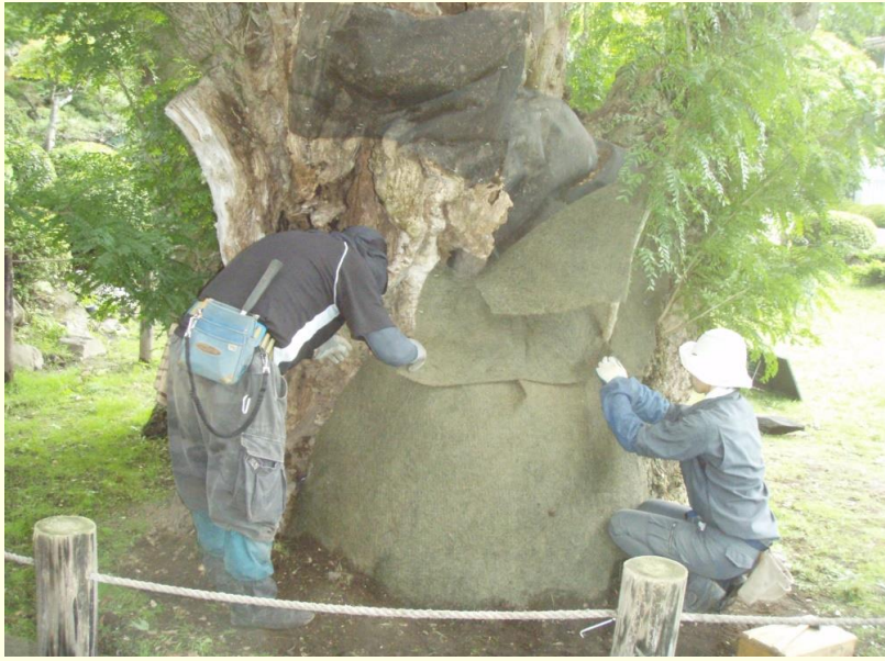
不定根促進工 新たな資材による補修