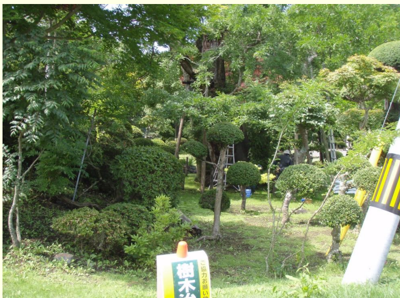
階上町大字角柄折 平のサイカチの木です。 着工前の全景