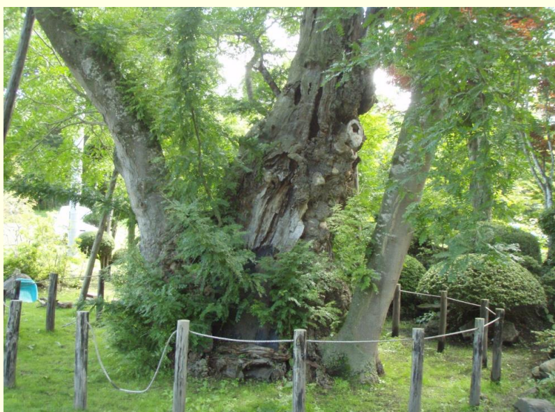
着工前の全景 前回治療した資材の剥離等がみられた